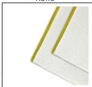
Cielos Rasos Termo / Acústico-Sky Clean