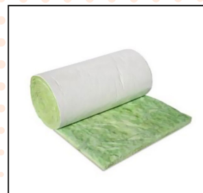
Fresca – Aislante Térmico Y Acústico Lana De Vidrio Prk