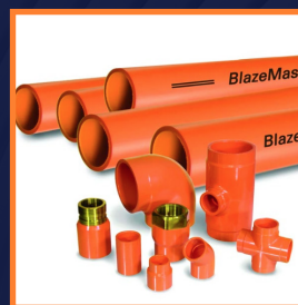
Tuberías De CPVC / Blaze Master