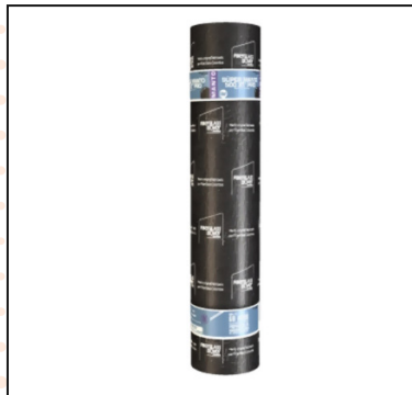
Mantos de Poliester