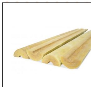
Cañuelas Fibra De Vidrio