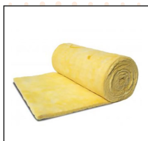
Aislante En Lana Mineral De Vidrio-Lana AW