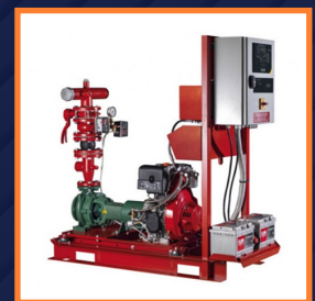
Bombas / Válvulas E Instrumentación