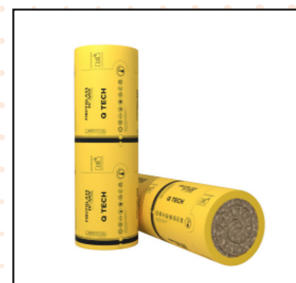
Lana Mineral Hidrófuga – Q Tech