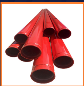
Tuberías De Acero Ranurada