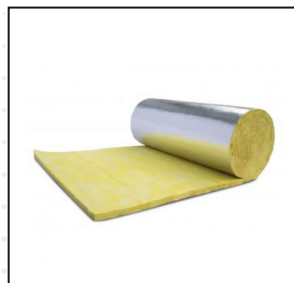
Lana Mineral De Vidrio – Flex Wrap