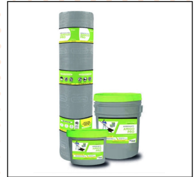
Sistema Amigo Pro