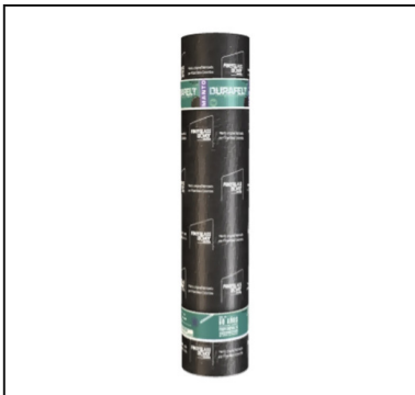
Membrana asfáltica Durafelt