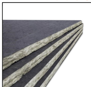
Ecovent – Aislante Térmico Y Acústico Hidrófugo