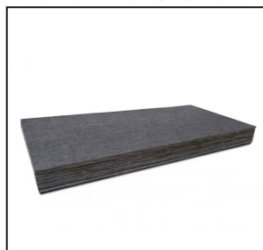
Black Theater Board Y Panel Acústico