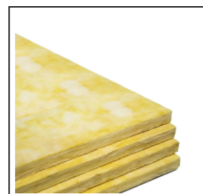
Lana Minera De Vidrio Placas – Insulquick