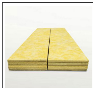
Atac Aislante Acústico