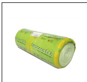
Fresca Eco – Aislante Térmico Y Acústico