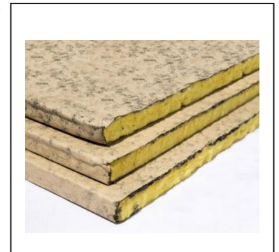
Roof Insulation HD