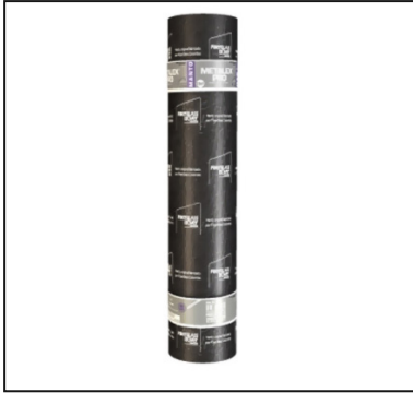
Cubierta reflectiva solar