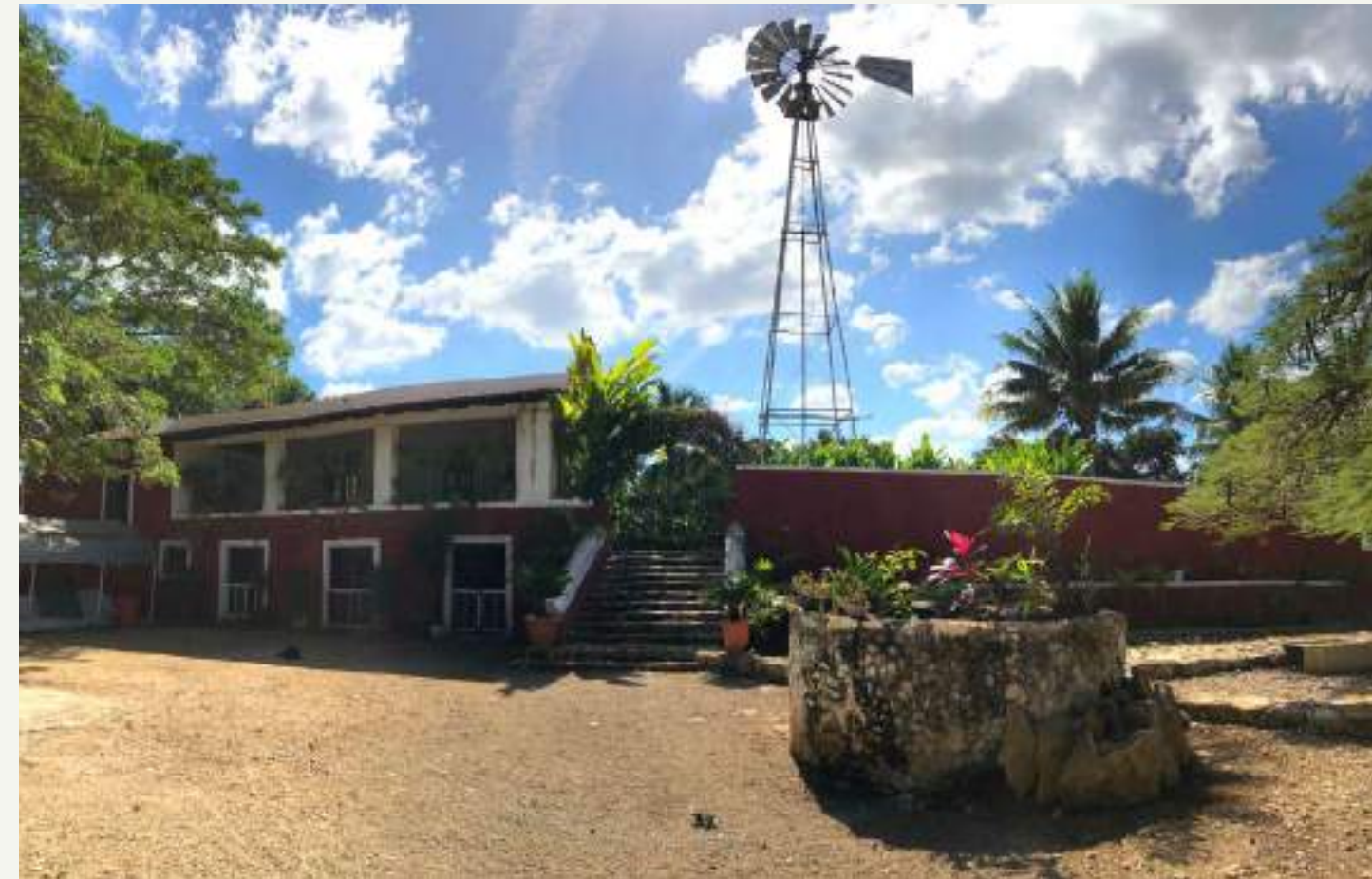
Imagen frontal de la Hacienda Carolina

La composición única del suelo, el clima y el sol implacable de Yucatán lo convierten en el lugar perfecto para cultivar estos pimientos picantes". 1