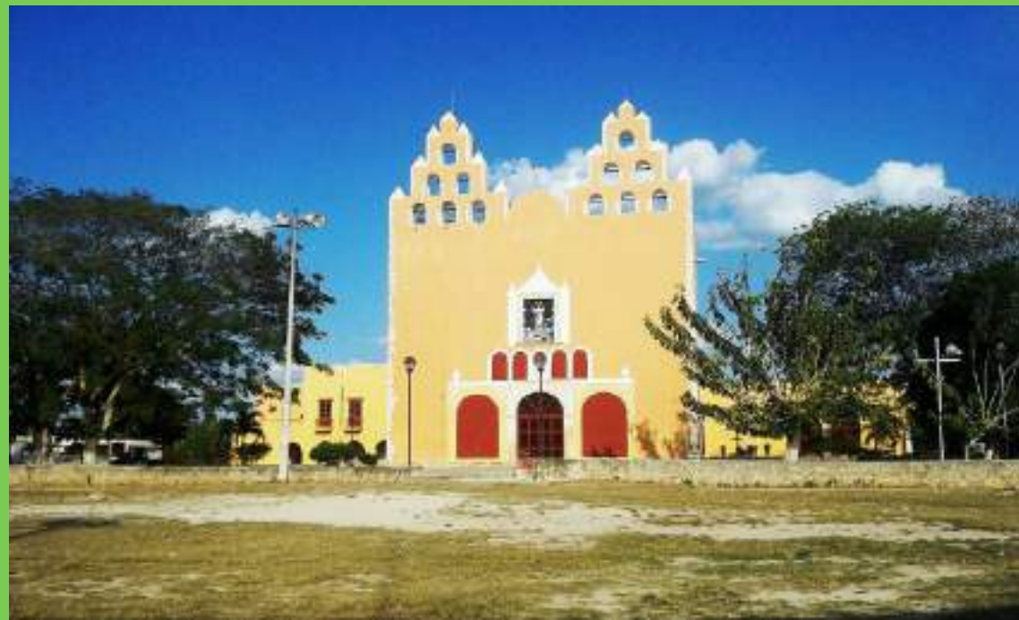
El ex-convento construido en el siglo XVII y dedicado a "Nuestra Señora de la Asunción"

Mocochá es un municipio de Yucatán que se ubica en la parte noroeste del estado. Su población supera los 3,000 habitantes. Mocochá significa literalmente en lengua maya, reflejo del nudo en el agua, por derivarse de las voces Moc , nudo; och , sombra y ha , agua. Una interpretación más libre establecería el significado de Agua del agujero.