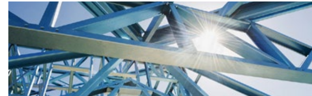
Construcción liviana/prefabricada, paneles y estructuras metálicas