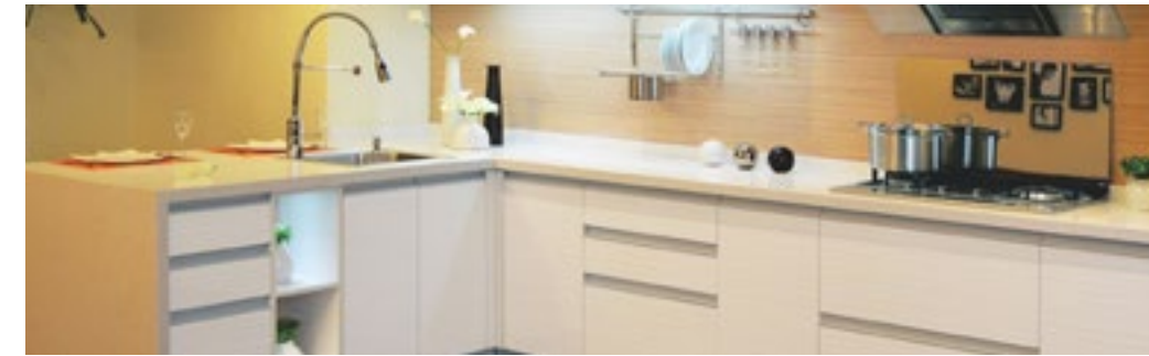
Carpintería de madera. Cocinas, placares y baño. Mdf y composite Wood melamínicos y madera sólida