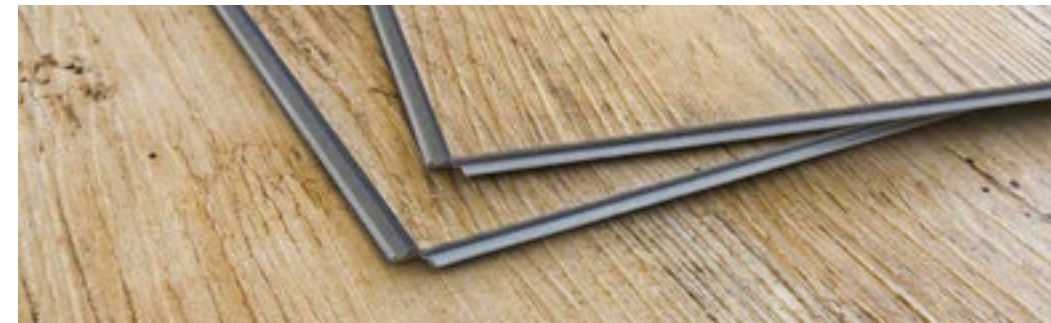
Pisos vinílicos, flotantes y bamboo