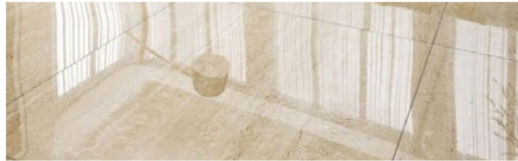
Revestimientos porcelánicos y cerámicos