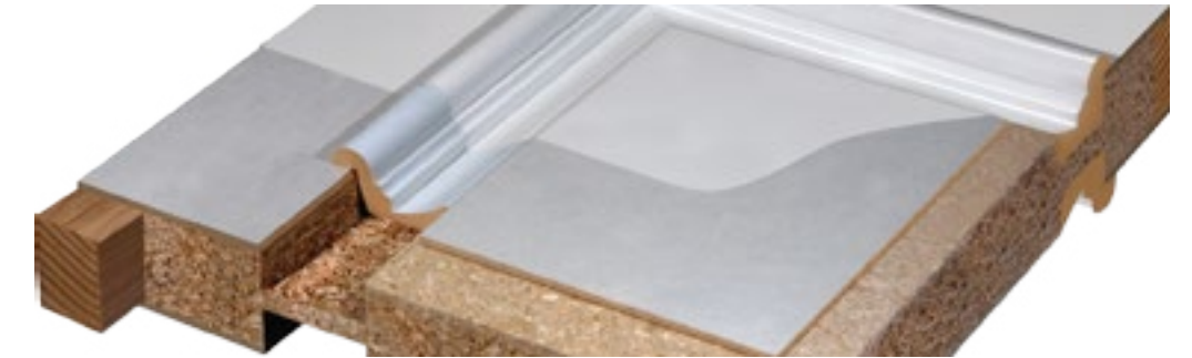
Puertas MDF, PVC y madera sólida