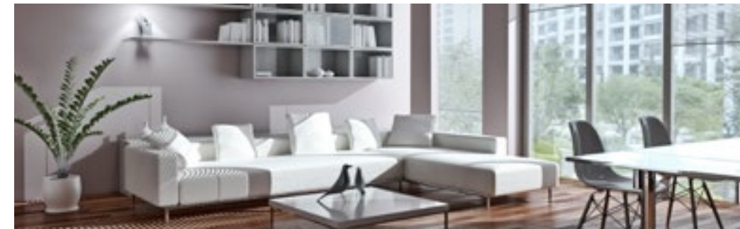
Equipamiento interior - mobiliario