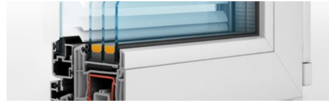
Aberturas de PVC y aluminio. Serie económica y alta prestación