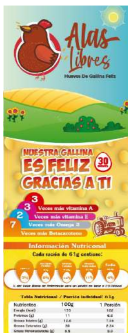
ETIQUETA DE LA CUBETA