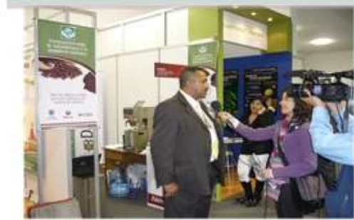
Congreso ACOPI 59 años Agosto 2010