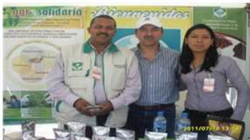
M. empresarial Ibarra Ecuador -