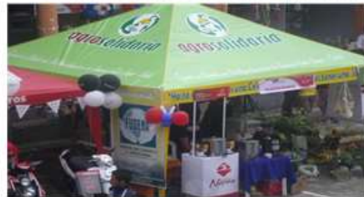
Feria EXPOUNION La Unión N. dic 2011