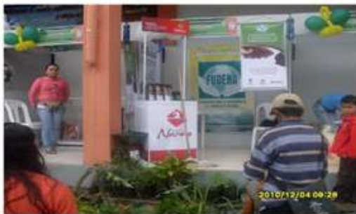
Feria EXPOUNION La Unión N. dic 2010