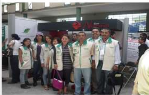
EXPOESPECIALES Pasto- Sep 2010