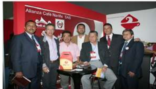
EXPOESPECIALES Bogotá- jun 2011