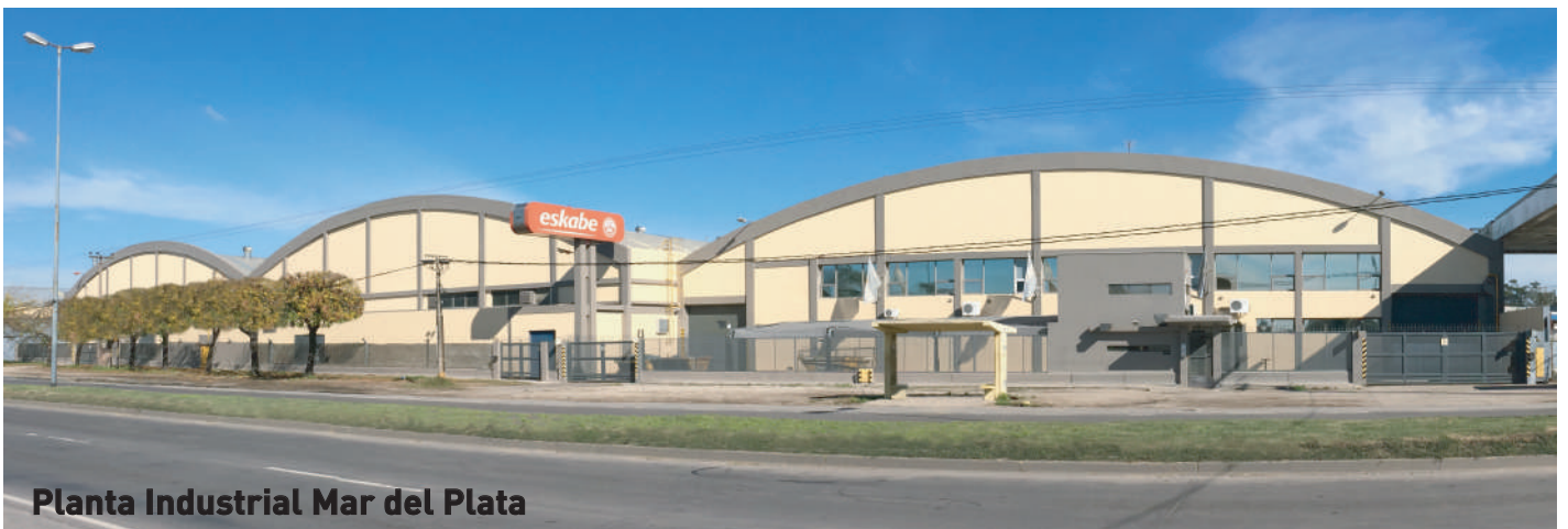
Planta Industrial Mar del Plata

Eskabe owns two industrial plants of high productive capacity. One of them is located in Mar del Plata and the other is in San Martín, province of Buenos Aires. Its structure is completed with an after-sales network of more than 170 authorized services in all the country.