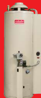
CLIMATIZADORES DE PISCINA