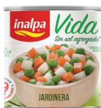
Jardinera Lata x 300 g