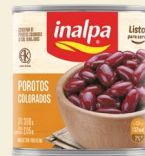
Porotos Colorados Lata x 300 g