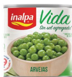
Arvejas Lata x 300 g