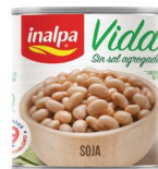
Soja Lata x 300 g