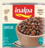
Lentejas Lata x 300 g