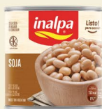
Soja Lata x 300 g