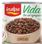
Lentejas Lata x 300 g