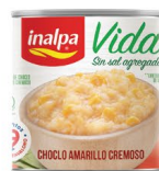
Choclo Amarillo Cremoso Lata x 300 g