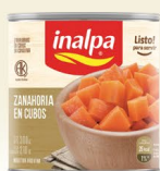
Zanahoria en Cubos Lata x 300 g