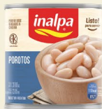
Porotos Lata x 300 g