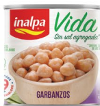
Garbanzos Lata x 300 g