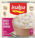
Choclo Blanco Cremoso Lata x 300 g Lata x 830 g