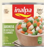
Jardinera Lata x 300 g Lata x 820 g Lata x 2.950 g