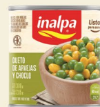
Duetto de arvejas y choclo Lata x 300 g