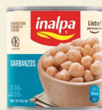
Garbanzos Lata x 300 g