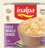
Choclo amarillo cremoso Lata x 300 g Lata x 830 g