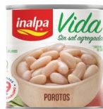
Porotos Lata x 300 g