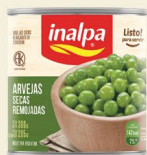
Arvejas Lata x 300 g Lata x 840 g Lata x 2.950 g