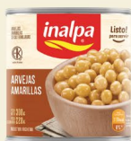
Arvejas Amarillas Lata x 300 g