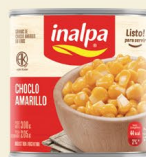
Choclo Amarillo Lata x 300 g Lata x 840 g Lata x 2.950 g