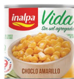
Choclo Amarillo Lata x 300 g