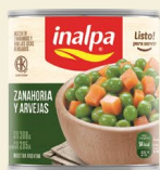
Arvejas y Zanahorias Lata x 300 g