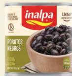
Porotos Negros Lata x 300 g