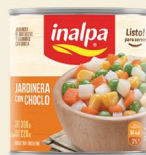
Jardinera con choclo Lata x 300 g