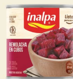
Remolacha Lata x 300 g