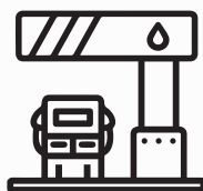
Estación de Servicio