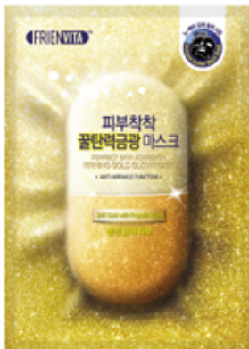
Firming glow 超强弹力金光

有着超强美白功效的肤然维他柚子维C处方, 加上黄金, 让你光彩照人的美白奢华面膜。