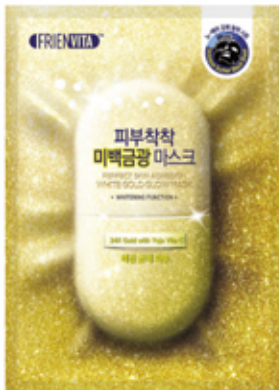
White glow 美白金光

有着超强弹力的肤然维他蜂胶维E处方, 加上黄金、黑珍珠粉, 打造玲珑闪耀蜜光肌的奢华面膜。