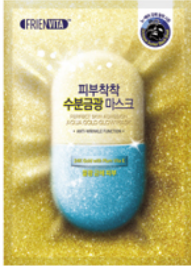
Aqua glow 补水金光