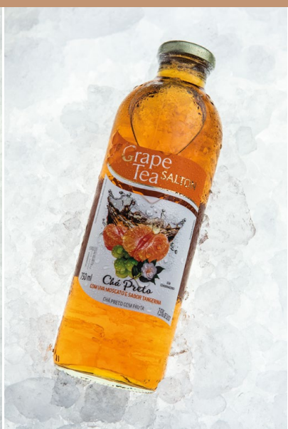
BEBIDAS SIN ALCOHOL