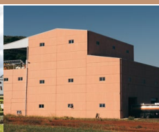
SANTANA DO LIVRAMENTO/RS

La principal instalación y oficina central con 334 tanques de acero inoxidable con capacidad de 25,564,700 litros (vinos, espumosos y jugos).