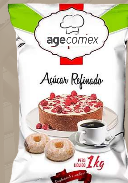
Refinado/Refined • 1 kg