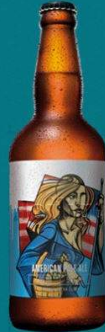
American Pale Ale