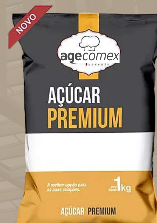
Premium • 1 kg