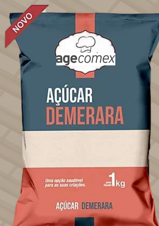
Demerara/Raw • 1 kg