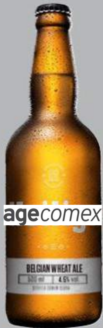
Belgium Wheat Ale