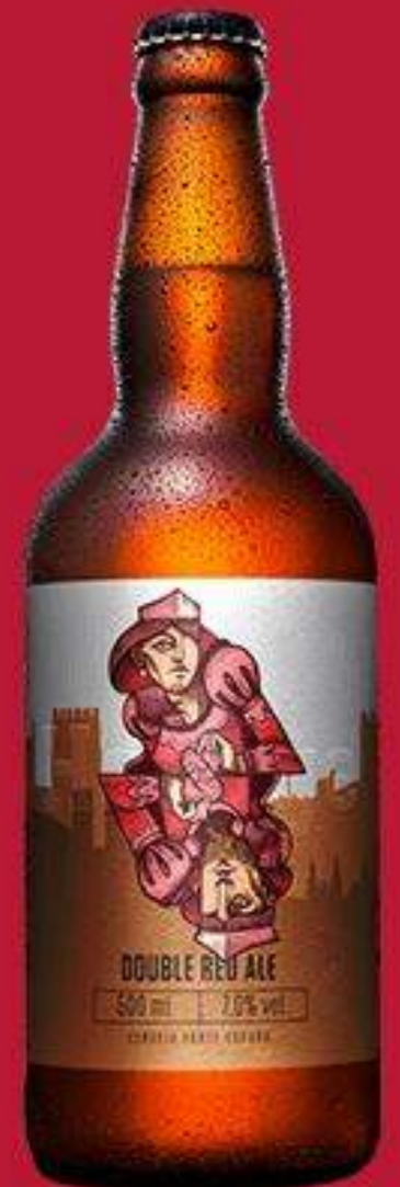
Double Red Ale