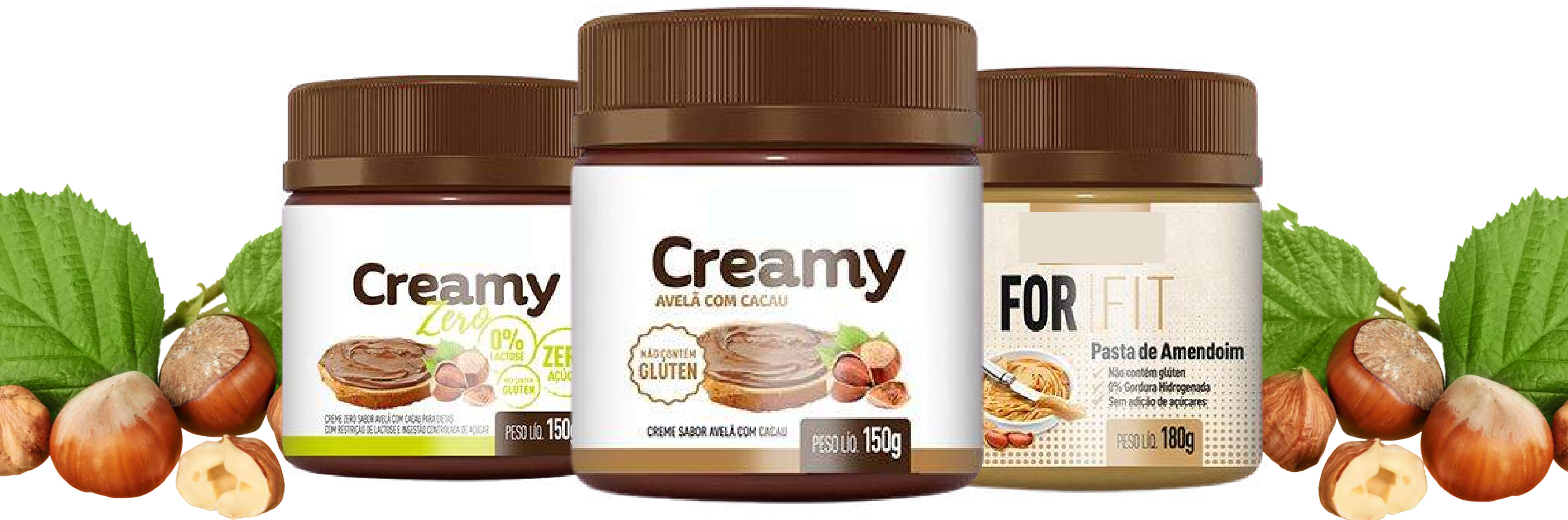
Crema Sabor Avellana con Cacao Zero sin Lactosa y Azúcar