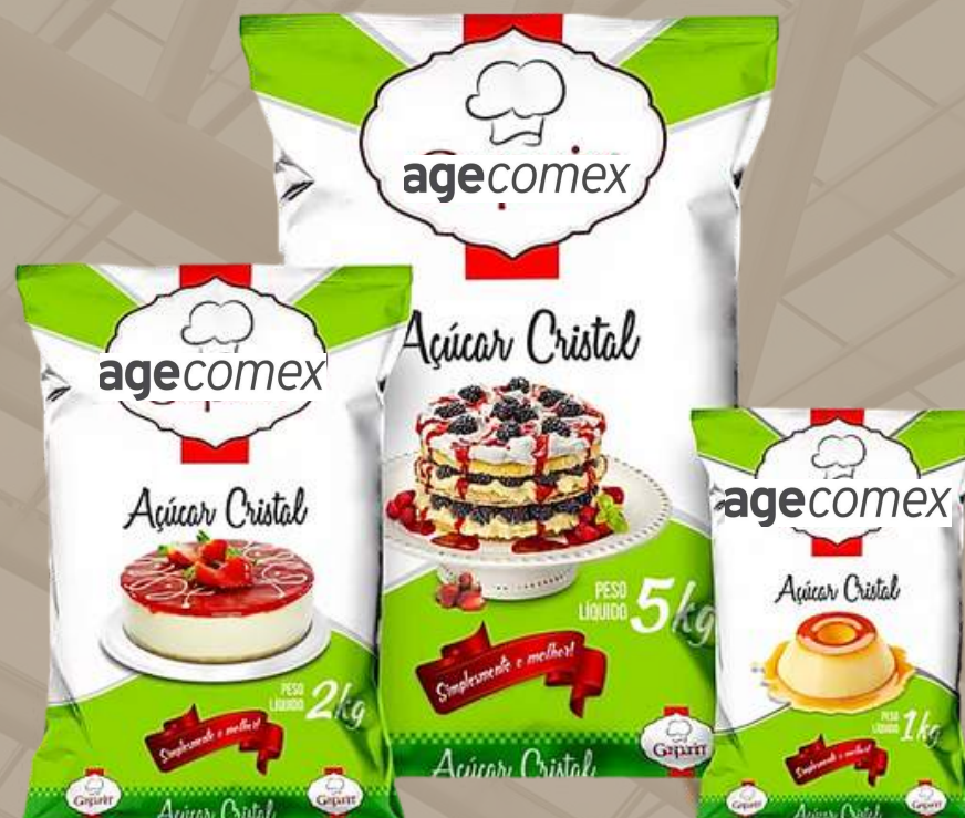
Cristal/Crystal • 1 kg, 2 kg and 5 kg