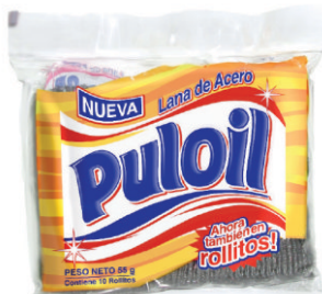
Rollito x 10 CH161 - 7840010035561 BL x 14 x 8