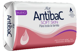
Mar Antibac Rosa - Softskin CP336 - 7840010037817 6 x 8 PA x 125g