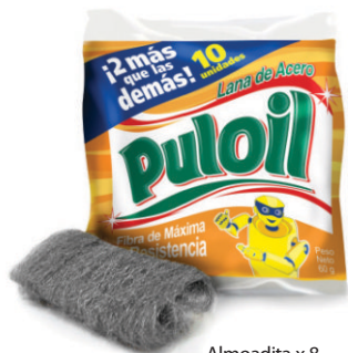
Almoadita x 8 CH388 - 7840010025401 BL x 14 x 10