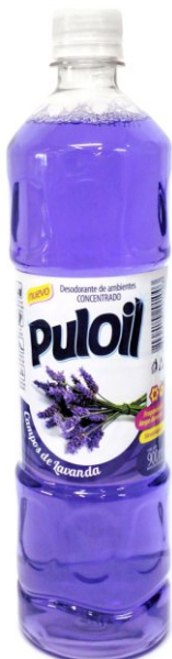
CH466 7840010201003 UN 900 ml x 1 x 12