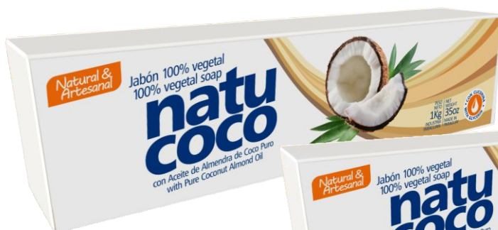
NATU COCO Jabón de Coco 100% Vegetal 7840010202253 UN 1 Kg x 25