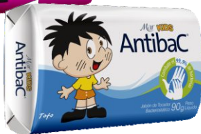
Mar Antibac KIDS Toto Varones Cp434 - 7840010037848 12 x 9 PA x 90g