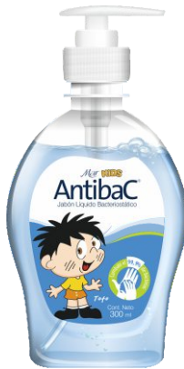
Mar Antibac Kids Toto Varones CP435 7840010200723 12xBT x300ml