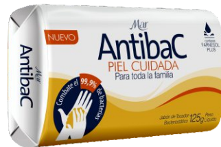
Mar Antibac Amarillo - Balance CP338 - 7840010037794 6 x 8 PA x 125g