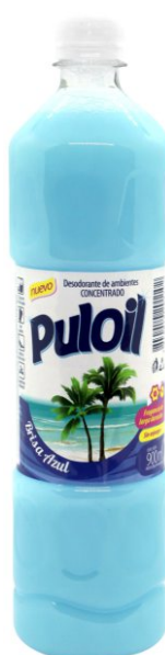
Brisa Azul CH467 7840010201102 UN 900 ml x 1 x 12