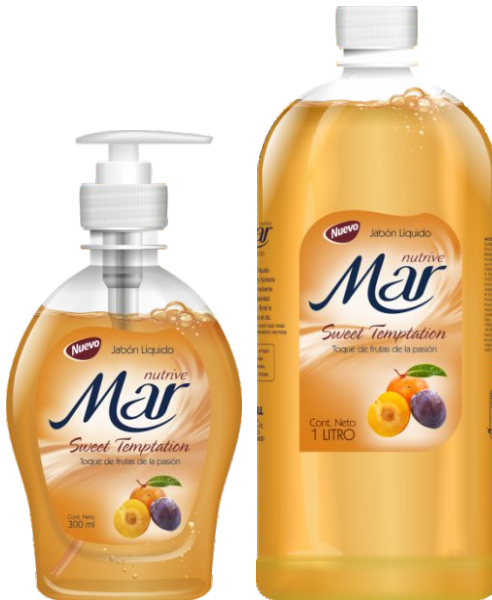
Mar Nutrive Sweet Temp. CP452 7840010037954 12 PA x 300ml