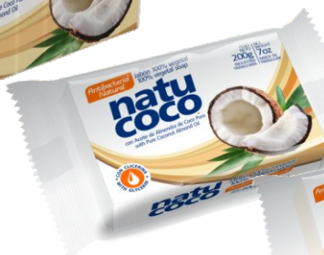
NATU COCO Jabón de Coco 100% Vegetal 7840010202239 UN 200 g x 30