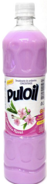
Explosión Floral CH465 7840010201089 UN 900 ml x 1 x 12