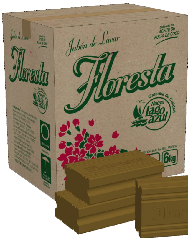
Jabón de lavar CH502 Caja x 24 unid x 250g