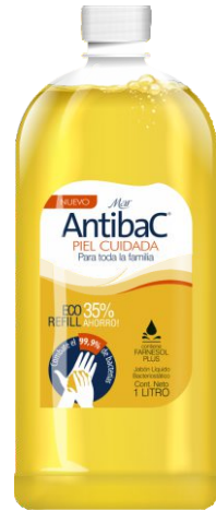
Mar Antibac Amarillo Refill CP329 7840010037879 6xBT x1000ml