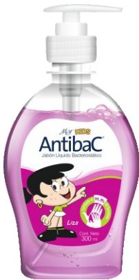
Mar Antibac Kids Liza Nenas Cp432 7840010200716 12 x BTx300ml