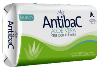
Mar Antibac Verde - Aloe CP337 - 7840010037800 6 x 8 PA x 125g