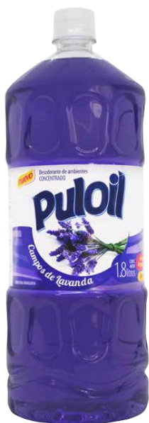
Campos de Lavanda CH478 7840010201652 UN 1800 ml x 1 x 6