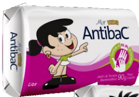
Mar Antibac KIDS Liza Nenas CP433 7840010037831 12 x 9 PA x 90g