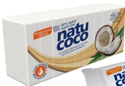
NATU COCO Jabón de Coco 100% Vegetal 7840010202260 UN 400 g (10x1) x 25