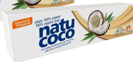
NATU COCO Jabón de Coco 100% Vegetal 7840010202246 UN 500 g x 25