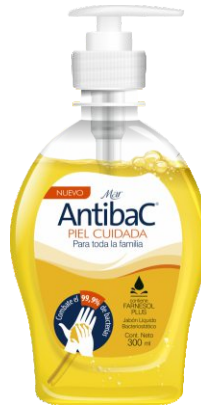
Mar Antibac Amarillo CP310 7840010037459 12xBT x300ml