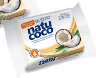
NATU COCO Jabón de Coco 100% Vegetal 7840010202222 UN 100 g x 36