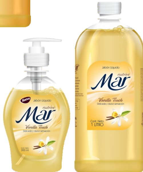
Mar Nutrive Vainilla Touch CP443 840010199911 12 PA x300ml