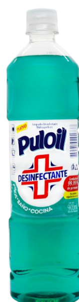
DESINFECTANTE CH479 7840010201737 UN 900 ml x 1 x 12