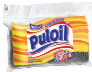
Rollito x 4 CH162 - 7840010035547 BL x 36 x 8