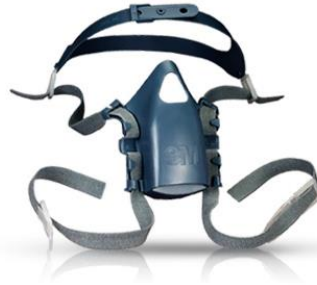
3M-7581 Repuesto de Arnés p/ Máscara Pieza 7502