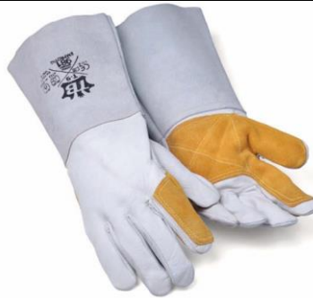
TB-981EMPROTIG Guante vaqueta, hilo kevlar, refuerzo en palma, 38cm