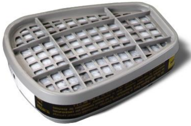
Cartucho 3M para Formol Aldehído