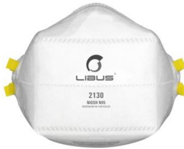
LB- 901801 Respirador Desechable Libus N95 2130 Plegable