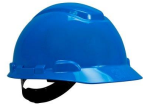
3M-H700 – Casco 3M H700