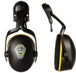
LB-90487 Protector Auditivo Copa Libus L-340 p/CASCO