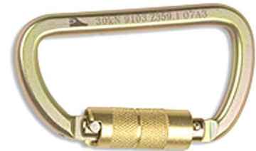
3M-210-07 - Mosquetón con de acero con auto bloqueo de 7/8"