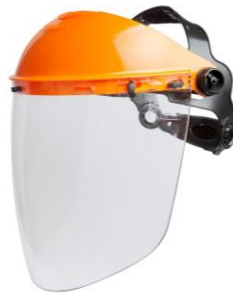
LB-901383/901386 Protector Facial Libus con arnés a cremallera