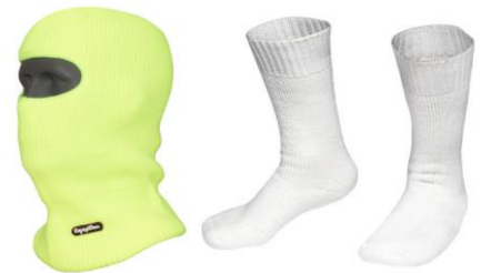
RW-0047VL – Pasamontañas y medias Refrigiwear