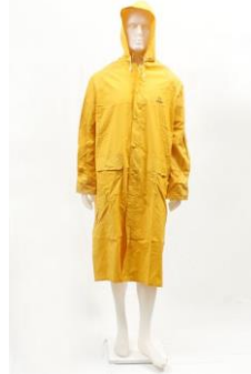
LS-623205 Capa de PVC Amarillo