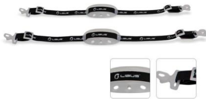
LB-902003 Mentonera Libus P/ Casco 15MM C/ LOGO Gancho C