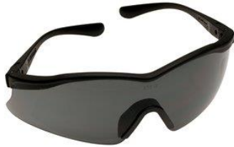
3M-15177/15177 Lente X Sport Transparente y Gris AF