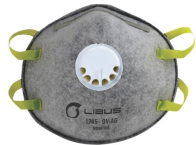
LB- 902622 Respirador Desechable Libus N95 1735 OV/AG c/ Valv