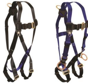
FT-7007 / 7017 Arnéses Faltech