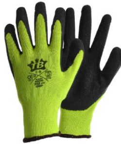
TB-302HV GRIP Guante de poliéster HI VIZ Palma de látex rugoso