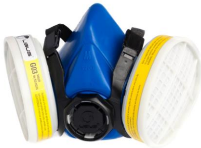
LB-901793 Respirador Libus 9000 De Media Cara