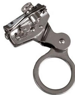
Frenos para Cabo y para cuerdas