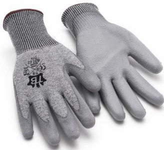
TB-401G2DYN Guante de fibra HPPE + fibra de vidrio sin costuras. Palma de poliuretano. Nivel Corte 5.