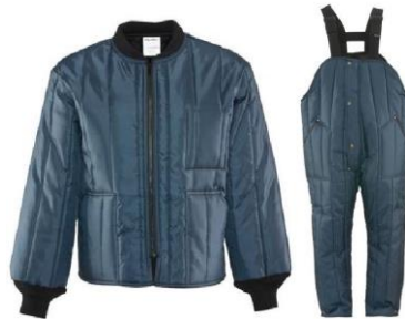
RW- 925 /085 Trajes Refrigiwear Econo-Tuff para temperaturas hasta -9°C