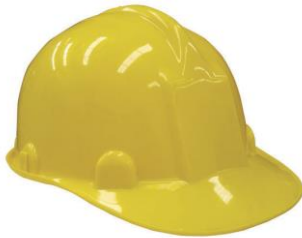
Cascos Novel c/ arnés Standard