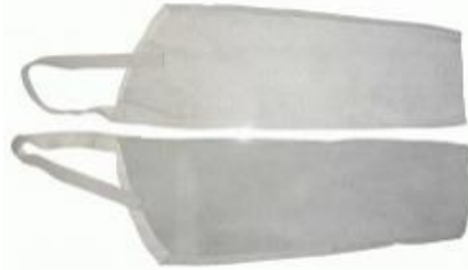
EQ-9112 Manga descarne