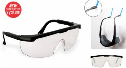
LB-900497//40098 Lentes Libus Argon Transparente y GrisAF