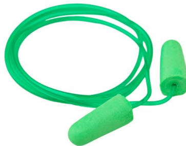
LB-400475 Protector Auditivo QUANTUM FOAM C/Cordel