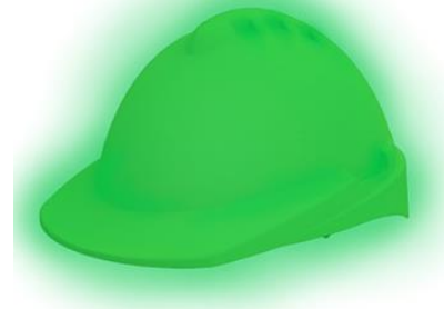
LB-903090 Casco Libus MILENIUM Class Fotoluminico