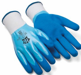
TB-765TOUCH Guante de nylon sin costuras. Recubrimiento completo nitrilo y nitrilo foam en palma. Grado alimenticio.