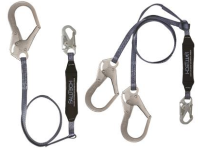
FT-82563 / 826073 Eslingas Falltech