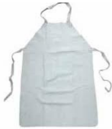
Delantal Descarne Corto / Largo