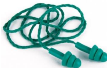
3M-1241 Tapones Reutilizables c/ cordón