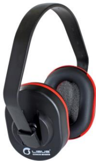
LB-901374 Protector Auditivo Copa Libus Alternative