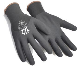
TB-750MFTOUCH Guante de nylon sin costuras. Recubrimiento nitrilo Microfinish hasta los nudillos