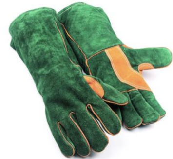
TB-911LR Guante Soldador de Descarne Forro doble polar, hilo de Kevlar. 40 cm