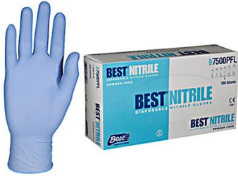
3M-7500PFL Guantes Desechable De Nitrilo Quirúrgico 100 Unid X Dispenser