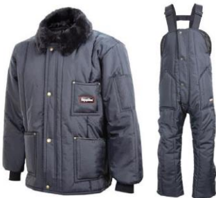
RW-322/385 Trajes Refrigiwear Iron-Tuff para temperaturas hasta -46°C