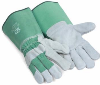
TB-201GLX Guante de descarnes c/ lona ignífuga