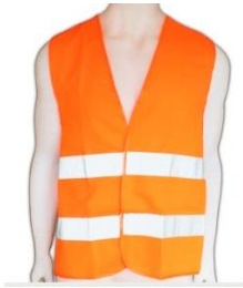
LS-623739/748 chaleco reflectivo Naranja y Amarillo