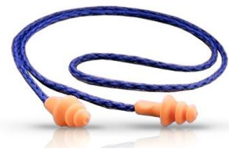
3M-1270 Tapones Reutilizables de Silicona c/ cordón