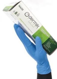
TB-NA35 Guante de Nitrilo desechable 5 mil de espesor grado alimenticio BOX x 100