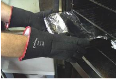
3M-8814 Guante Char Guard cubierto de Neoprene Tejido Hasta 260° C