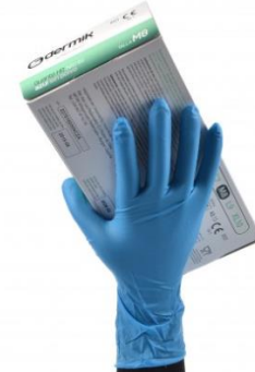
TB-6080HR Guante de Nitrilo Alto Riesgo 40 mil de espesor grado alimenticio BOX x 50