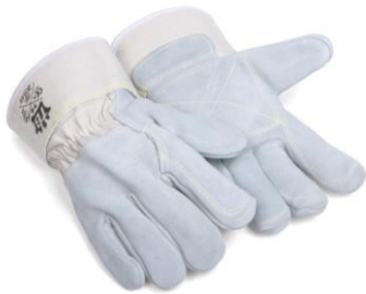
TB-205KV Guante de cuero c/ refuerzo interior en palma y dedos. Hilo Kevlar.