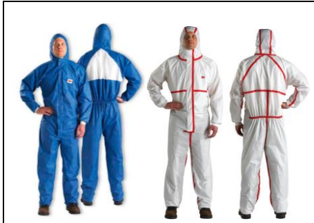
Traje de Protección Descartable