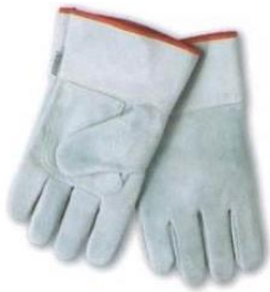
EQ-1101 Guante Americano Descarne Puño Corto