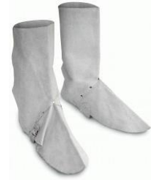
EQ-9212 Polainas Descarne