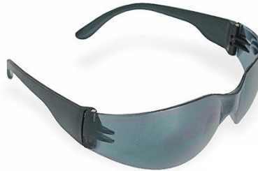
LB-90559/900556 Lente Libus Ecoline Transparente y Gris AF