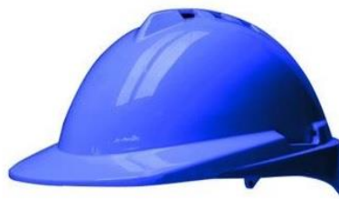
LB-902389 Casco Libus MILENIUM Class