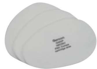
LB-901913 Filtro Libus Particulas P95