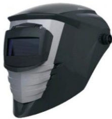
LB-902885 Máscara Soldador Strong Welder 500 (Pasiva)