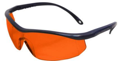
LB-902463 Lente ARGON ELITE Naranja