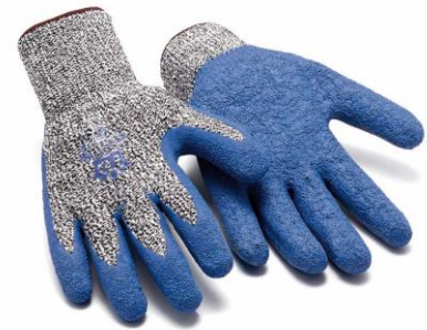
TB-487TFLN Guante de tejido Tuffalene + fibra de vidrio sin costuras. Puño de látex rugoso. Nivel Corte 5