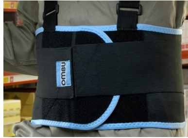
Faja Lumbar, Talle S-M-L-XL-XXL