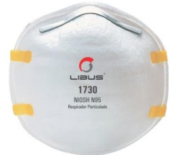
LB-901798 Respirador Desechable Libus N95 1730