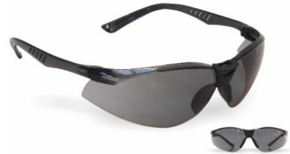
LB-902027/902028 Lentes Libus Neon Transparente y Gris AF