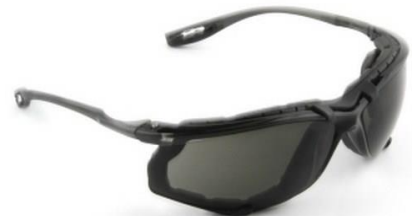
3M-18873 Lente Virtua CCS Gris AF con espuma