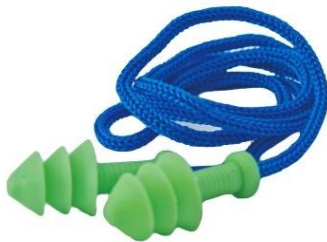
LB-900473 Protector Auditivo Libus Quantum