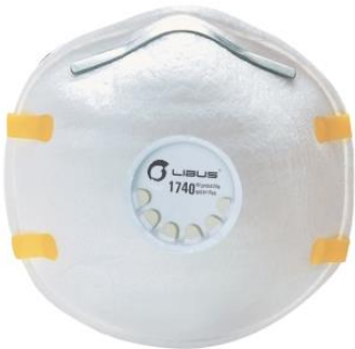
LB-901799 Respirador Desechable Libus N95 1740 c/ Valvula