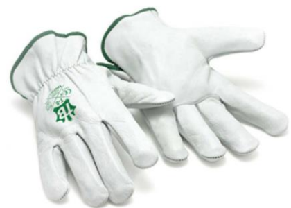
TB-160IBSZ Guante medio paseo de vaqueta con Norma EN388