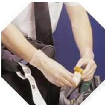
3M-2005 Guantes Real Feel desechables de Vinil Libre de Polvos -100 Un. x disp.