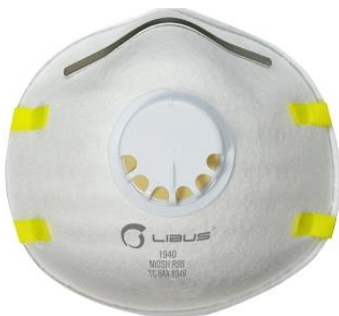
LB- 902957 Respirador Desechable Libus R95 1940 c/ valv