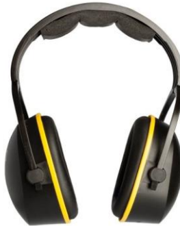
LB-90476 Protector Auditivo Copa Libus L-340 con Vincha