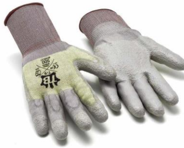
TB-500NEVERCUT Guante de nylon con Kevlar sin costuras. Recubrimiento poliuretano gris en dedos reforzados.