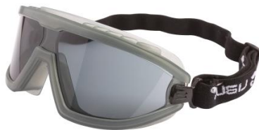
LB-902421 Antiparra Libus Aviator Transparente / Gris AF