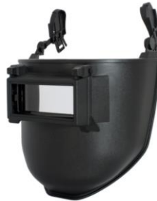
LB-901700 Máscara Soldador p/Casco - Modelo 500C