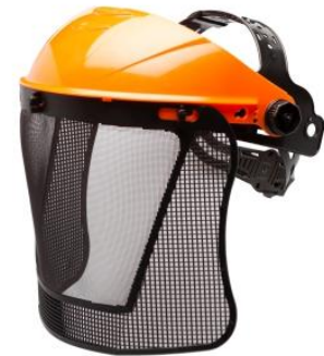
LB-901383/901389 Protector Facial Libus Malla con arnés a cremallera