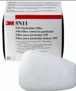
3M-5N11 Pre-Filtro p/ polvos, neblinas, pinturas en spray y pesticidas