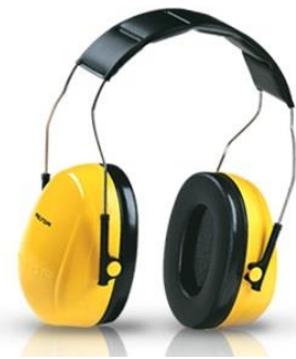
3M-H9A Protector Auditivo Optime 98 C/ Banda Para Cabeza