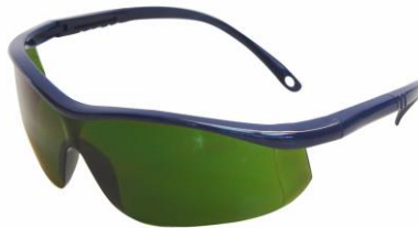
LB-902040 Lente ARGON ELITE Dark Green W3 AF