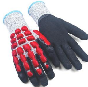
TB-490RMF Guante de HPPE, recubrimiento nitrilo microfinish en palma, látex anti-impacto en dorso