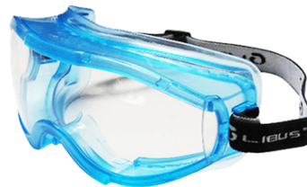
LB-902107 Antiparra Libus New Classic Transparente / Gris AF