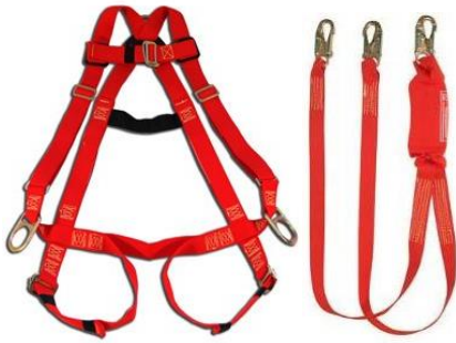
Arnés Saturn Ignífugos para Soldadura y línea de vida