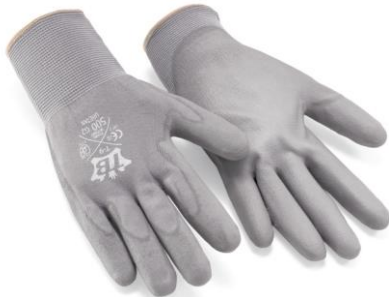
TB-500G2URETAN Guante de nylon sin costuras. Palma de poliuretano.