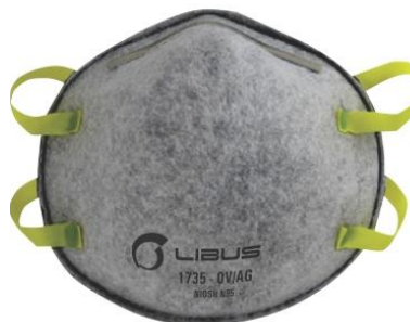
LB- 902621 Respirador Desechable Libus N95 1735 OV/AG