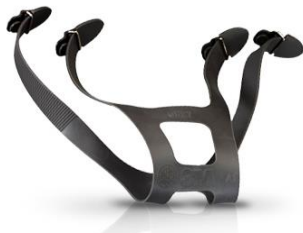
3M-6897 Repuesto de Arnés p/Máscara 6800