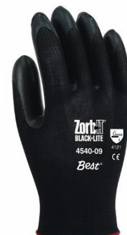
3M-4540 Guantes Zorb-It Black Lite Nylon recub. esponja de Nitrilo