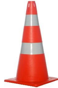
Conos Naranja/Blanco de 50cm