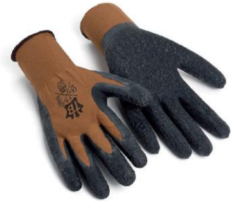
TB-320GRIP Guante de nylon sin costuras. Palma de látex rugoso.