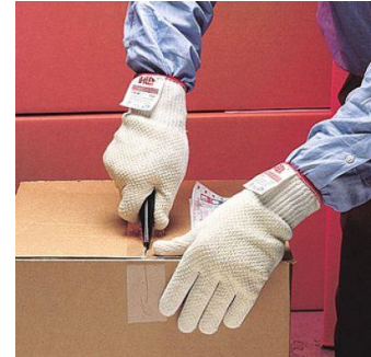
3M-910 Guante D-Flex Plus Stainless Steel