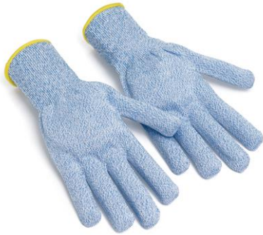
TB-KMG700CS Guante de Fibra TEKORA puntas de dedos reforzadas Nivel Corte 5