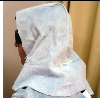
EQ-9612 Gorro de Descarne c/ Nuquera