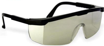
LB-900500 Lentes Libus Argon Outdoor/Indoor