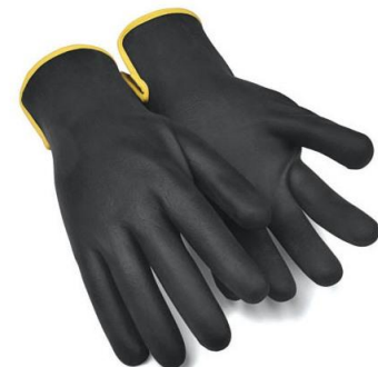
TB-767DRIVER Guante de nylon sin costuras. Recubrimiento completo nitrilo foam.