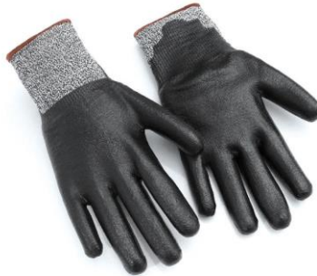
TB-482TFLN Guante con tejido TUFFALENE, recubrimiento completo de nitrilo foam negro. Nivel Corte 5