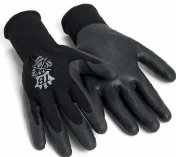
TB-700NG2FP Guante de Poliéster negro sin costuras. Recubrimiento nitrilo foam.