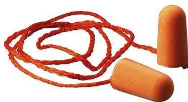
3M-1110 Tapones Desechables de Espuma C/ Cordón