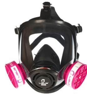
LB-901844 Respirador Libus 9900 de cara completa