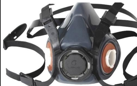
LB-902852 Respirador Libus 9050 De Media Cara