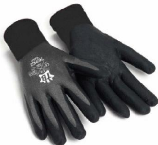
TB-765NG2TOUCH Guante de nylon sin costuras. Recubrimiento completo nitrilo y nitrilo foam en palma. Grado alimenticio