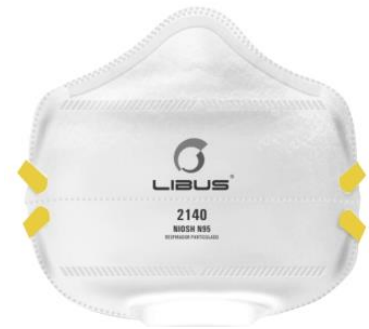
LB- 901803 Respirador Desechable Libus N95 2140 Plegable c/ valv