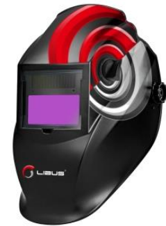
LB-901399 Máscara Soldador Fotosensible-Serie 1500