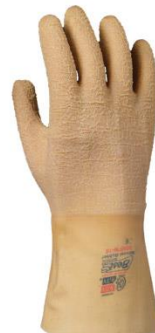
3M-65NFW Guante Nitty Gritty anticorte de caucho natural acabado rugoso