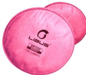
Filtro Libus para Particulas