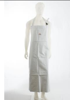
LS-674655 Delantal de PVC Blanco