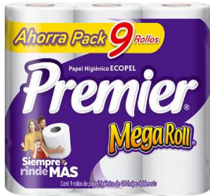
AHORRA PACK 9 ROLLOS