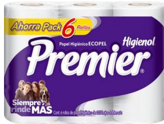
AHORRA PACK 6 ROLLOS