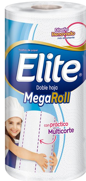
TOALLA DE PAPEL 180 HOJAS