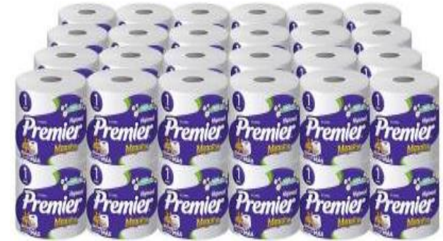
INDIVIDUAL PREMIER 400 HOJAS 40X1 PREMIER 350 HOJAS 48X1