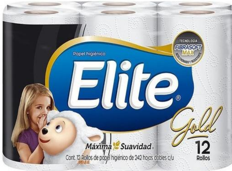
AHORRA PACK 12 ROLLOS