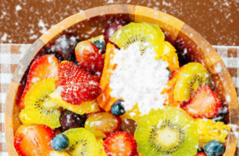
Tabela descritiva do produto: Coco desidratado Fino 1Kg

Pode-se misturar o coco ralado em qualquer tipo de comida, bolos, cereais, curries, sorvetes e saladas de frutas.