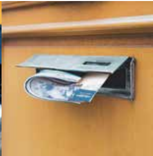
MAILING Y FOLLETERÍA