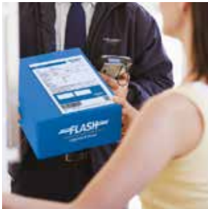
PIEZAS CON ACUSE DE RECIBO.