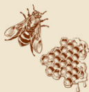
cera de abeja