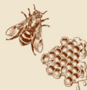
cera de abeja