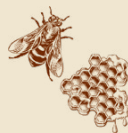
cera de abeja