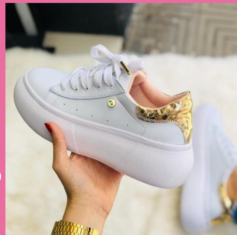
Ref: P 423 Color: Blanco