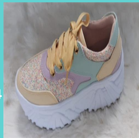
Ref: P 454 Color: Pastel