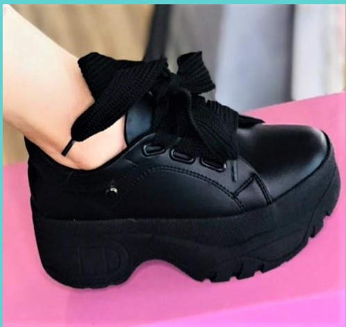
Ref: P 449 Color: Negro Talla: 34 al 40