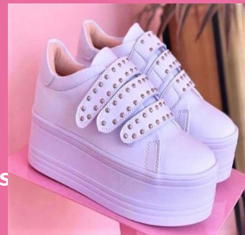
Ref: P 427 Color: Blanco x Taches