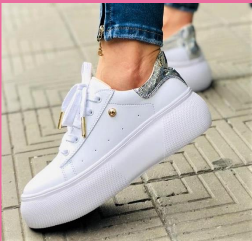
Ref: P 420 Color: Blanco Talla: 34 al 40