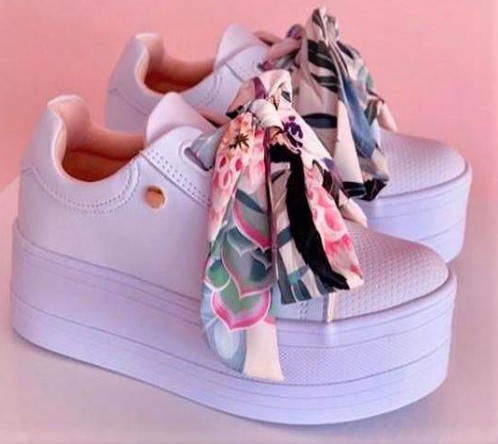
Ref: P 424 Color: Blanco Talla: 34 al 40