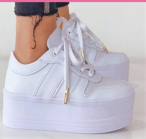
Ref: P 426 Color: Blanco Talla: 34 al 40