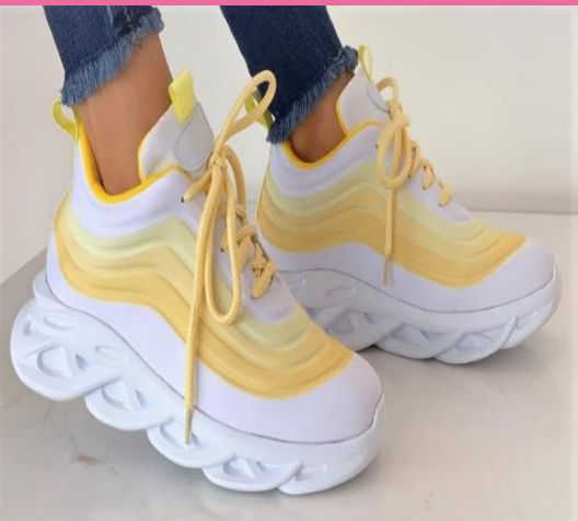
Ref: P 430 Color: Blanco x Amarillo Talla: 34 al 40