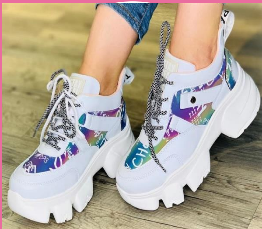
Ref: P 428 Color: Blanco x Tonos Talla: 34 al 40