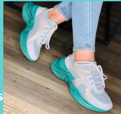
Ref: P 452 Color: Mentas Talla: 34 al 40