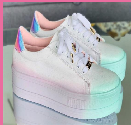
Ref: P 425 Color: Blanco Talla: 34 al 40