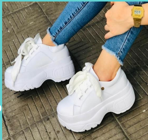
Ref:P 448 Color: Blanco Talla: 34 al 40