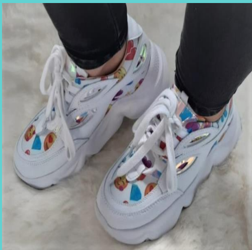
Ref: P 453 Color: Esparki Talla: 34 al 40