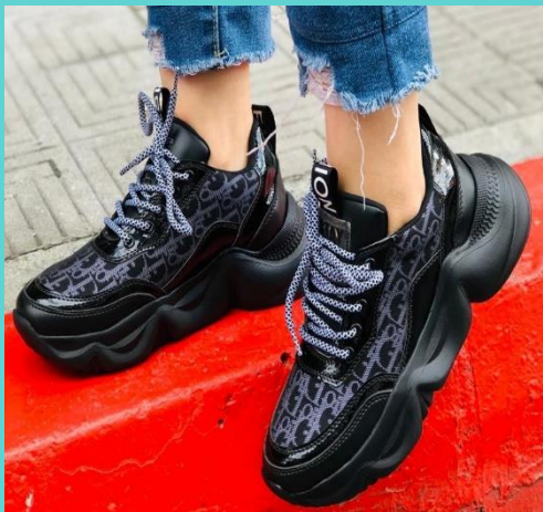
Ref: P 447 Color: Negro Talla: 34 al 40