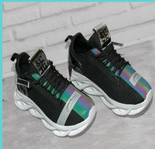
Ref:P 450 Color:Flex