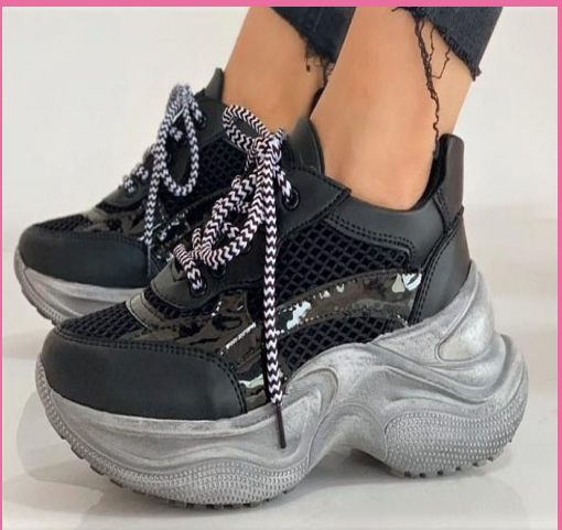
Ref: P 431 Color: Negro