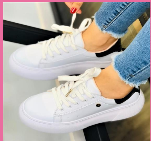
Ref:P 422 Color: Blanco Talla: 34 al 40