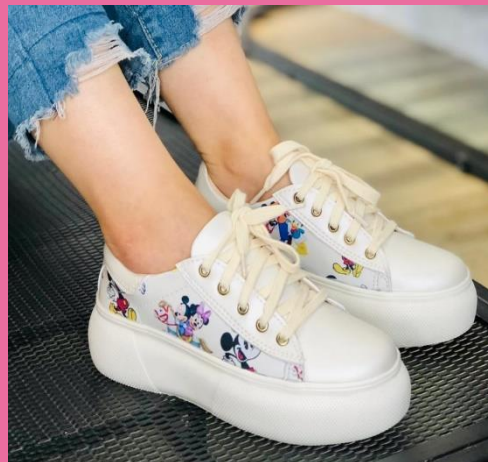
Ref: P 421 Color: Mouse Talla: 34 al 40