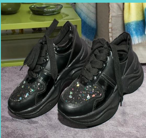
Ref: P 451 Color: Negro Talla: 34 al 40