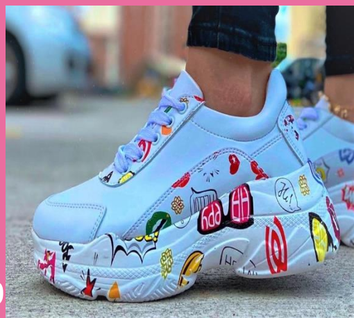
Ref: P 429 Color: Happy Talla: 34 al 40