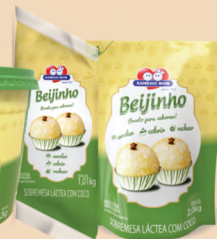
Pouch Pastelero 1,01kg