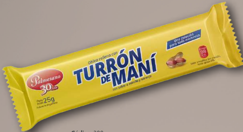
Código: 200 Turrón Oblea 50 x 25 g.