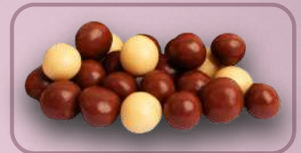
Código: 366 Bolitas de Licor a Granel

35011 Cereal con Chocolate 6 kg. 35222 Mini galletita leche