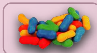
Código: 38001 Huesitos Frutales

38069,1 "CHOOK" Mini Lent.choc. Surtidas 11 kg.