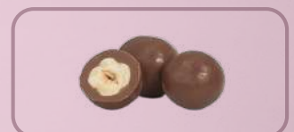
Código: 38033 Avellanas con chocolate

38018 Esferitas Frutales 14 kg. 38003 Piedritas . 38014 Grageas 38004 Lentejas Frutales 38001 Huesitos Frutales 38035 Mini Bananas Frutales 38038 Mini Bananas Amarillas 38009 Huesito Chocolate