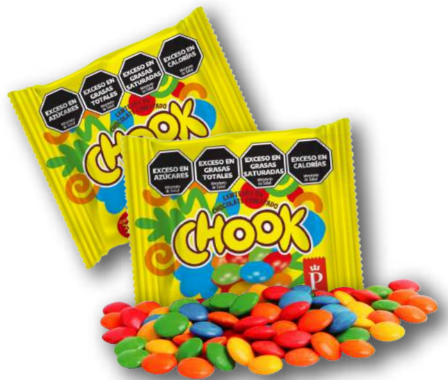
Código: 965 Lenteja de Chocolate CHOOK 12 x 24 x 30 g.