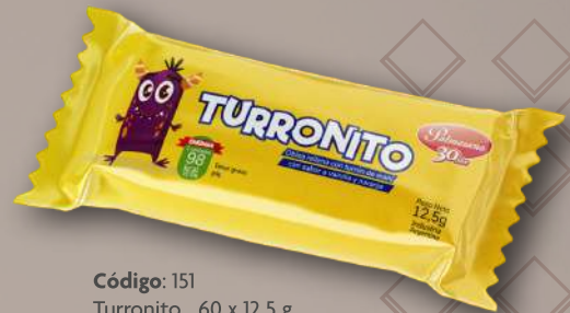
Código: 151 Turrónito 60 x 12.5 g.