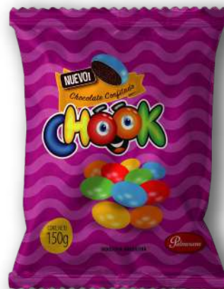
Código: 4750 Lenteja de Chocolate CHOOK 24 x 150 g.