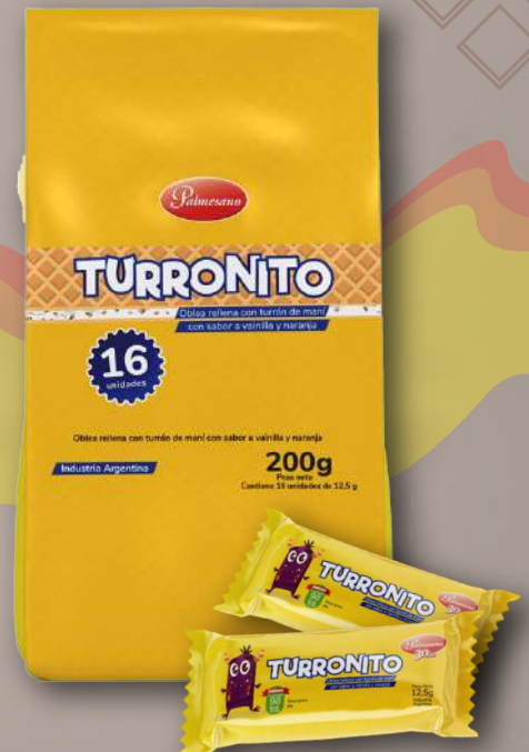
Código: 130 Turrónito en bolsa 12 x 16 x 12.5 g.