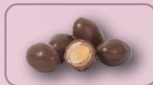
Código: 38024 Maní con Chocolate

38015 Mani Crespado 8 kg. 560.8 Garapiñada de Maní 38055 Peladilla de Almendras 38066 Garapiñada de Almendras 35005 Grana de Maní