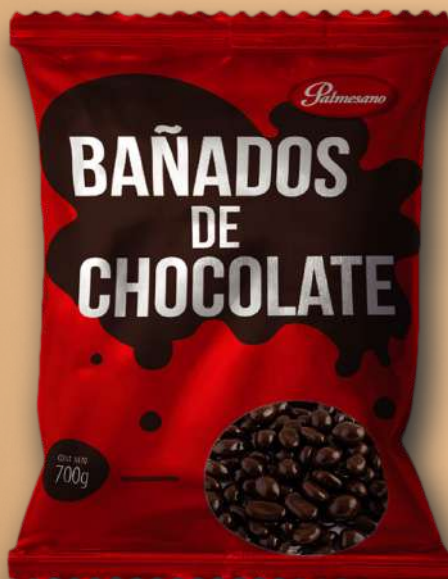
► Código: 4833.7 Avellanas con Chocolate