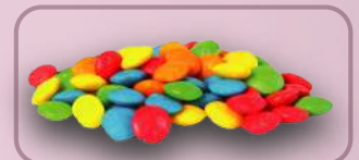
Código: 38004 Lentejas Frutales

38005 Banderita 10 kg. 38017 Fru - Fru 38010 Maní sabor Chocolate 38013 Gotitas Frutales 38016 Peladilla de Maní 38006 Maní Japones 38033 Avellanas con Chocolate 38044 Pasas de Uva con Chocolate 38045 Maní con Chocolate Blanco 38024 Maní con Chocolate 38050 Almendras con Chocolate 38060 "CHOOK" Lenteja de chocolate 10 kg. 38065 Garapiñada con chocolate 35002 Crocante de Maní 35003 Crocante de Maní sabor Almendras 35004 Crocante de Maní sabor Chocolate 366 Bolitas de Licor a Granel