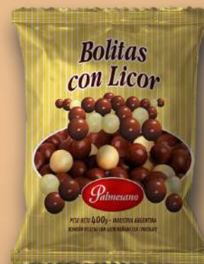
Código: 362,0 Bolitas de Licor 18 x 400 g.