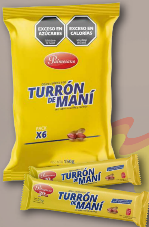
Código: 204 Agrupado turrón 30 pack x 6 unid. x 25 g.