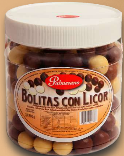
Código: 360,0 Bolitas de Licor 6 x 800 g.