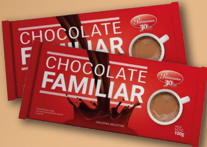
Código: 333,0 Chocolate para Taza 6 x 10 x 100 g.