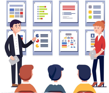
ASESORIA Y CAPACITACIÓN