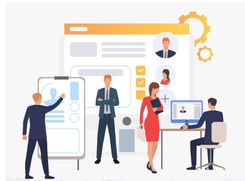
RECURSOS HUMANOS Y NÓMINA