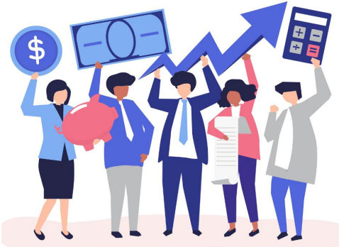
CONTABILIDAD Y FINANZAS