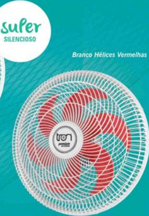
Branco Hélices Vermelhas