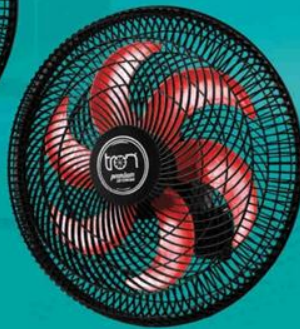
Preto Hélice Vermelha