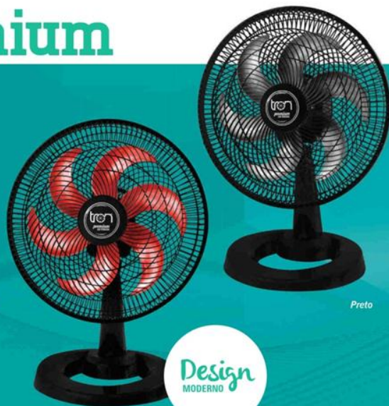
Preto Hélice Vermelha