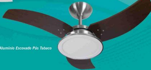
Alumínio Escovado Pás Tabaco