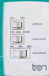
Controle de Velocidade Ventilador de Teto