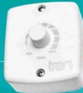
Controle de Velocidade Oscilante de Parede

50cm: 07.02-0534 60cm (200W): 07.02-0533 60cm: 07.02-0587