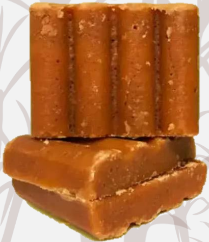
Panela en pastilla