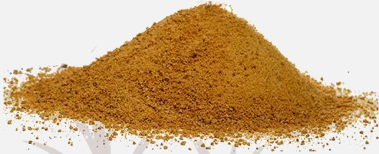
Panela en polvo